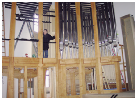
. . . in der Orgel