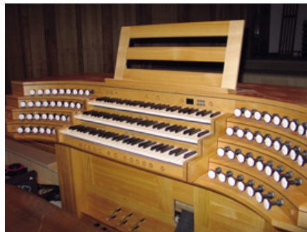
Die Spieltisch aus Kirschbaumholz

sprechen den Materialien im Eingangsbereich. Im reizvollen Kontrast hierzu stehen die Prospektpfeifen der Orgel aus Orgelmetall. Die Ausführung des Gehäuses in geöltem Kirschbaumholz greift den Farbton der Bronze aus dem Lebensweg, von Altar und Auferstehungsstele auf. Beeindruckend ist beim Betreten der Orgelempore der Anblick des Spieltisches, ebenfalls aus geöltem Kirschbaumholz, der gleichsam aus dem mit Kirschbaum-Parkett belegten Fußboden herauswächst.