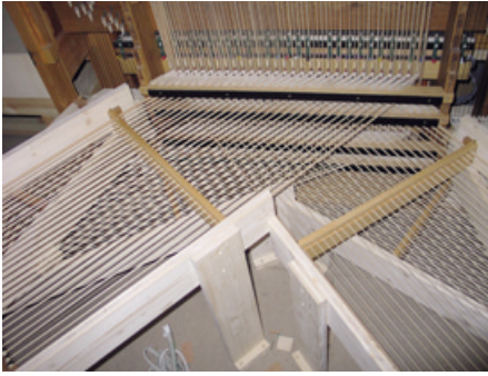
Umlenkungen der Traktur

Die Orgel ist letztlich ein Blasinstrument, 9 Windbälge besorgen hier den langen Atem, den das Pfeifenwerk benötigt.