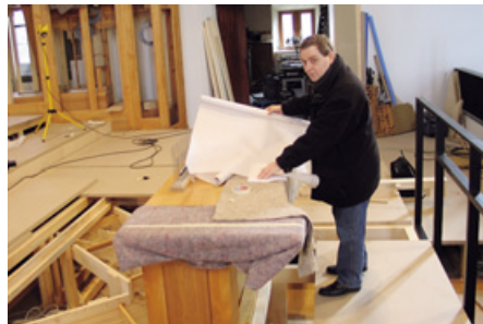
Der Organist . . . auf der Baustelle

genommen. Nur dieser symphonische Orgeltypus kann vom besinnlich meditativen Pianissimo bis hin zum strahlend festlichen Fortissimo die ganze Bandbreite menschlicher Empfindungen musikalisch ausdrücken. Durch seine Vielseitigkeit kann dieses Instrument auf die unterschiedlichsten Gottesdienstformen klanglich eingehen.