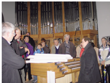
. . . bei Führungen

Es war ein langer Weg von meinem ersten Konzept- und Dispositionsentwurf bis zum fertigen Instrument. Verschiedene Orgelbauer, die in der Lage waren unsere Wünsche umzusetzen, wurden ausgesucht und um ein Angebot gebeten. Der Sieger dieser Ausschreibung ist Ihnen ja inzwischen bekannt. Nur die Firma Mühleisen konnte uns aufgrund ihres architektonisch und klanglich schlüssigen Angebotes vollends überzeugen. Natürlich hat auch der kurze Weg zur Orgelwerkstatt – wie sich inzwischen gezeigt hat – riesige Vorteile bei der Zusammenarbeit gebracht. So haben Künstler, Architekt und ich etliche Stunden mit Herrn