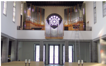
Die Orgel als architektonisches Element

Die Vorgabe des Bischöflichen Bauamtes, die Rosette in der Ost-Fassade zu erhalten, erschwerte die Planung der Orgel, musste doch deswegen das Orgelwerk geteilt werden. Im Nachhinein betrachtet erscheint die Vorgabe eher als glücklicher Umstand, auch wenn sich die Kosten damit erheblich erhöhten. Die Teilung des Orgelwerks wurde vom Orgelbauer geschickt umgesetzt.