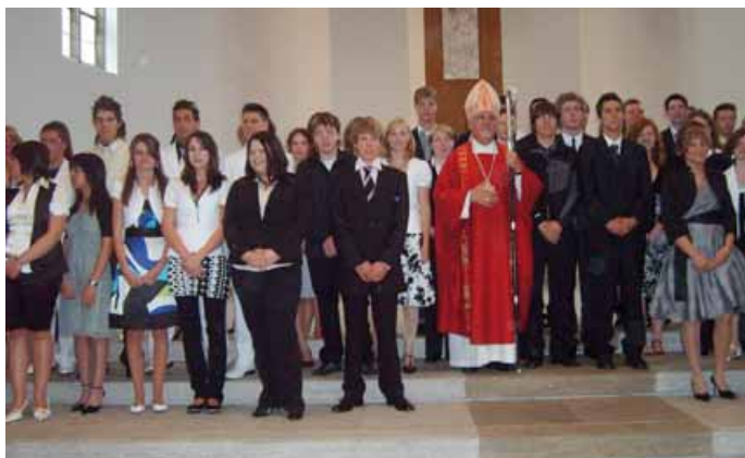
Firmung mit Bischof Gebhard

51 Jugendlichen und 5 Erwachsenen spendete Bischof Dr. Gebhard Fürst am 15. Juni das Sakrament der Firmung, auf das sie seit Januar in 9 Firmgruppen durch 11 FirmgruppenleiterInnen hingeführt worden waren.