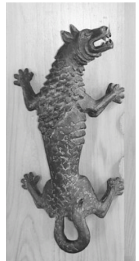
...und der Wolf von Gubbio

Die Warmbronner Katholiken wünschten sich jedoch ein eigenes Gotteshaus. Im Juni 1988 erfolgte der erste Spatenstich zum Bau der Franziskuskirche nach den Plänen von Architekt Karl-Hans Neumann aus Leonberg. Nach etwas mehr als einem Jahr Bauzeit kam Weihbischof Kuhnle zur Einweihung. Die Weihe der neuen Kirche wurde mit einer Festwoche gefeiert.