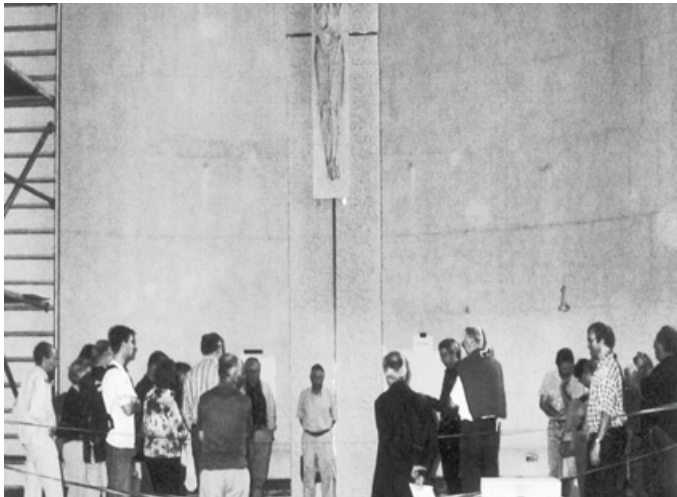
Entwurf der Stele