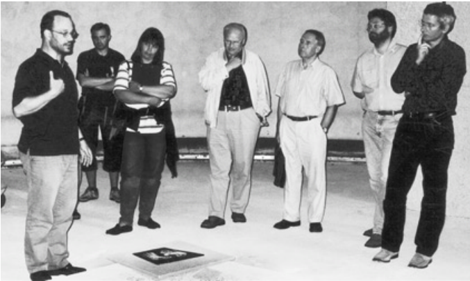
Modell des Taufortes

In seiner Sitzung am 2. 6. 2005 standen für die Renovation unserer St. Johanneskirche wichtige Entscheidungen auf der Tagesordnung. Eine schnelle Beschlussfassung war notwendig, damit die Renovationsarbeiten zügig vorangehen können. Erfreulich war, dass der KGR viele interessierte Gäste begrüßen konnte.